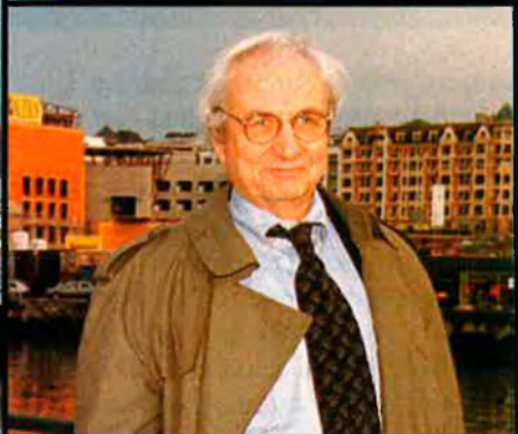
Sobre aquestes ratlles dues mostres de l'arquitectura-espectacle. El Museu Guggenheim de Bilbao, dissenyat per Frank O. Gehry (a sota), n'és l'exponent més reeixit. La Ciutat de les Arts i de les Ciències, de Santiago Calatrava (a dalt), és una mostra menys aconseguida.

van saber aprofitar una bona oportunitat. Es van trobar que, en el centre de la ria, la indústria siderúrgica tancava i quedava un espai buit que necessitava una intervenció molt forta. Dues persones, el conseller de Cultura del Govern