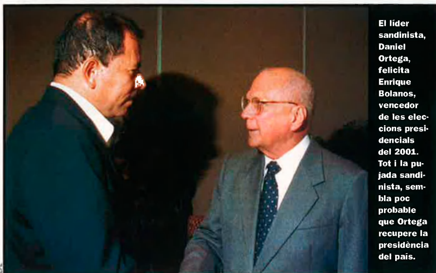
El líder sandinista, Daniel Ortega, felicita Enrique Bolaños, vencedor de les eleccions presidencials del 2001. Tot i la pujada sandinista, sembla poc probable que Ortega recupere la presidència del país.

Els sandinistes han aconseguit incorporar un votant nou, bàsicament jove, gràcies a la bona gestió que en general han fet en els alcaldies on governen –i molt especialment a Managua– i a la política d'incorporar la democràcia participativa en els pobles a través de les anomenades assemblees populars. Però tothom reconeix que, gràcies a la seua política d'aliances en el Congrés, l'FSLN ha pogut derivar importants quantitats del