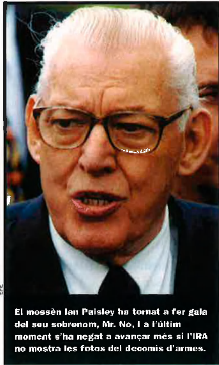
El mossèn Ian Paisley ha tornat a fer gala del seu sobrenom, Mr. No, i a l'últim moment s'ha negat a avançar més si l'IRA no mostra les fotos del decomís d'armes.

Amb tot, el mossèn unionista necessita gestos d'aquests, ja que s'ha passat sis anys, des que es van aprovar els acords de pau, renegant-ne, assegurant que els destruiria i basant totes les acusacions contra Trimble dient que era un traïdor. Això, però, no el va privar d'agafar les carteres ministerials que li pertocaven i ara esperar amb candaletes que quan es torni a recompondre l'executiu nord-irlandès ell en sigui el primer ministre. El setmanari The Economist afegeix que l'entronització al càrrec de Paisley serà "una victòria pírrica", ja que la salut no la té massa bona als seus vuitanta anys i el seu partit (i la seva església, la Presbiteriana Lliure) estan lligats als avatars de la seva figura (i la seva salut), sense