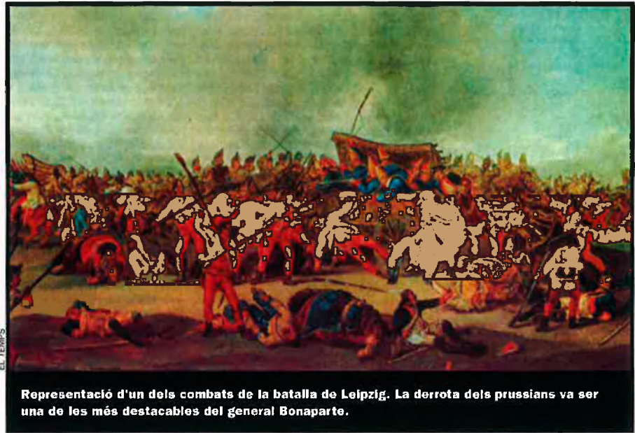
Representació d'un dels combats de la batalla de Leipzig. La derrota dels prussians va ser una de les més destacables del general Bonaparte.

A la fi de 1813, tres exèrcits aliats dirigits pel tsar, l'emperador austríac i el rei de Prússia travessaven el Rin. A Alemanya s'havia creat una consciència nacional contra França, els fonaments d'una enemistat històrica gens natural que va durar gairebé un segle i mig. El 31 de març de 1814, els aliats van entrar a París.