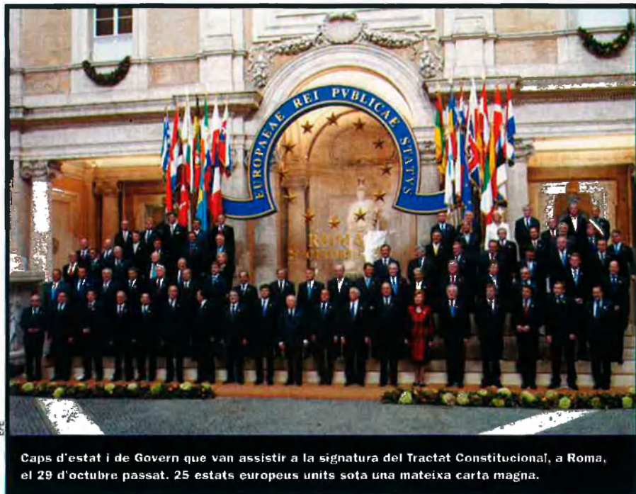
Caps d'estat i de Govern que van assistir a la signatura del Tractat Constitucional, a Roma, el 29 d'octubre passat. 25 estats europeus units sota una mateixa carta magna.

Aquesta era la base del pacte entre l'emperador i la nova elit: tots dos estaven units per l'interès comú. Napoleó es presentava com a garant contra el retorn i les pretensions de restitució dels antics nobles, però també era baluard contra el radicalisme dels jacobins i dels sans culottes (encara no se'ls anomenava "proletaris"), que preferien impulsar la revolució permanent. "Jo no governo amb la plebs", deia sovint Napoleó quan queia en la temptació de mobilitzar les masses populars. El conqueridor, l'estrateg genial, el modernitzador i renovador d'Europa actuava en primer lloc com a ciutadà—emperador i alliberador nacional—. És de fet en aquest punt on residia la força del seu reformisme, però també el