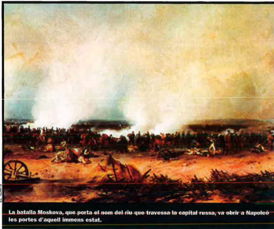
La batalla Moskova, que porta el nom del riu que travessa la capital russa, va obrir a Napoleó les portes d'aquell immens estat.

perit del món a cavall”, va escriure, orientat per l'exemple de Napoleó: “Un dia, Alemanya s'unirà pel poder del conqueridor.”