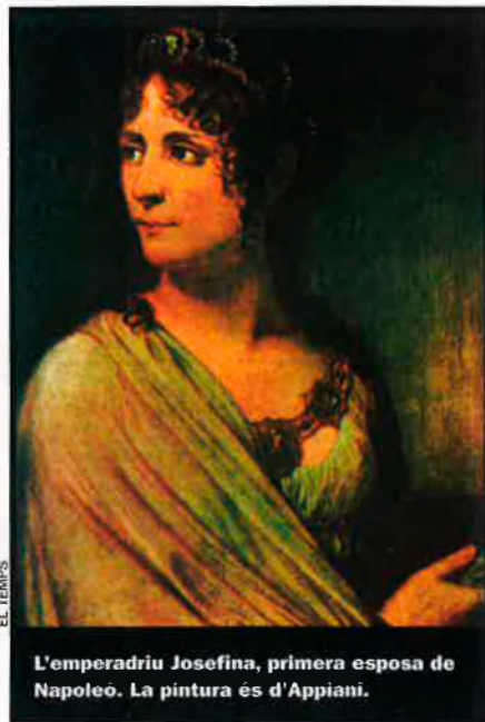
L'emperadriu Josefina, primera esposa de Napoleó. La pintura és d'Appiani.

Però, també segons De Gaulle, Napoleó tenia les seves mancances com a polític: va ultrapassar el límit del possible,