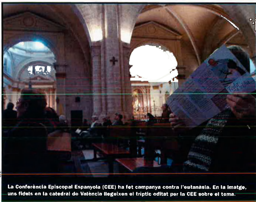
La Conferència Episcopal Espanyola (CEE) ha fet campanya contra l'eutanàsia. En la imatge, uns fidels en la catedral de València llegixen el tríptic editat per la CEE sobre el tema.

tícia i espera l'arribada de la policia i del metge forense per fornir totes les informacions necessàries.