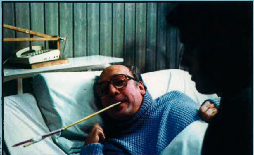
L'associació catalana Dret a Morir Dignament va intentar que els tribunals acceptessin la voluntat de Sampedro, en aquesta imatge interpretat per Javier Bardem en Mar adentro .

Ramón Sampedro ha estat el cas més conegut de sol·licitud d'eutanàsia a l'estat espanyol. Els tribunals van negar-li aquesta opció i Sampedro va idear una estratègia perquè moltes mans diferents intervinguessin en la seva mort.