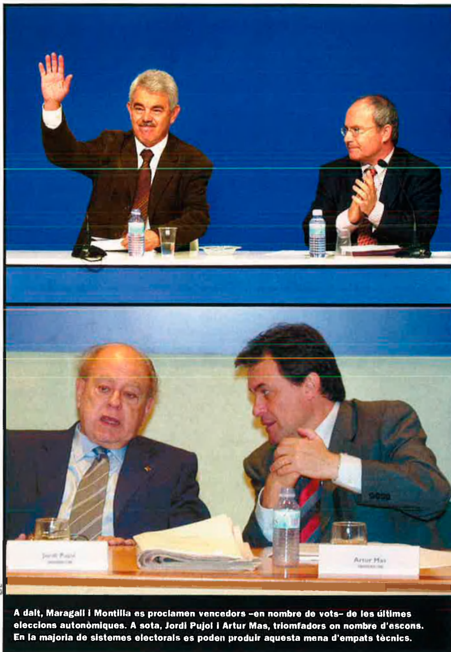
A dalt, Maragall i Montilla es proclamen vencedors –en nombre de vots– de les últimes eleccions autonòmiques. A sota, Jordi Pujol i Artur Mas, triomfadors on nombre d'escons. En la majoria de sistemes electorals es poden produir aquesta mena d'empats tècnics.

recta de deu representants, per a la Vall d'Aran, dos i tres més que serien elegits pels catalans residents fora de Catalunya. Tot plegat suma 55 escons d'elecció directa. La resta, fins a 135 diputats, serien triats per un sistema proporcional, aplicat a cada una de les vegueries sortints de la futura reordenació territorial de Catalunya.