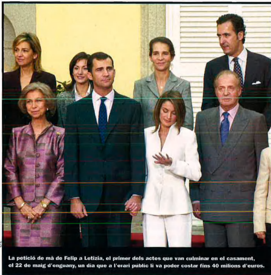
La petició de mà de Felip a Letizia, el primer dels actes que van culminar en el casament, el 22 de maig d'enguany, un dia que a l'erari públic li va poder costar fins 40 milions d'euros.

interina. Però en cap cas identifica quina autoritat, si n'hi ha, té potestat, i com i per què, per inhabilitar el monarca, dins del mateix ordre constitucional.