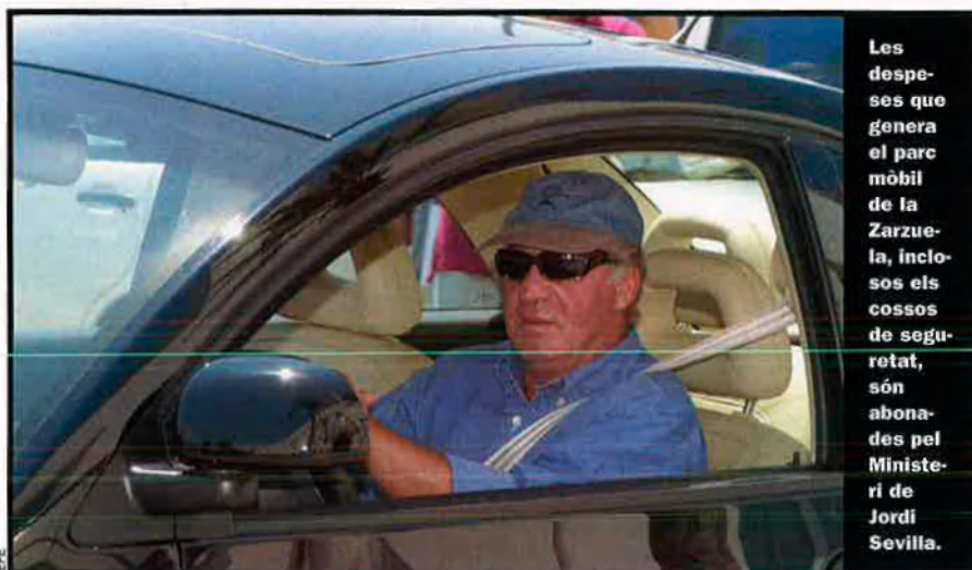
Les despeses que genera el parc mòbil de la Zarzuela, inclosos els cossos de seguretat, són abonades pel Ministeri de Jordi Sevilla.

no es pot deduir de la potestat de lliure distribució que no hagi de donar cap compte de res. No obstant això, la manca de definició constitucional abans esmentada, i sempre entesa en favor del blindatge dels interessos reials, torna a actuar. En cap moment no es donen explicacions de cap despesa econòmica. I, com sempre també, els partits majoritaris mantenen fèrriment tancat el pacte de silenci. És per aquesta raó que és del tot impossible conèixer com es gasta el rei l'assignació que anualment li paguen els ciutadans amb els seus impostos. Aquesta situació, lògicament, i com ja ha estat dit, és del tot insòlita a tota altra monarquia constitucional.