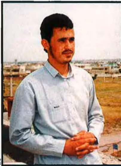
Esquerra, imatge d'Al-Zarqawi presa a finals dels vuitanta i difosa per Internet. A la dreta, conseqüències de l'atemptat de l'11-M de Madrid comès per una cèl·lula islamista.