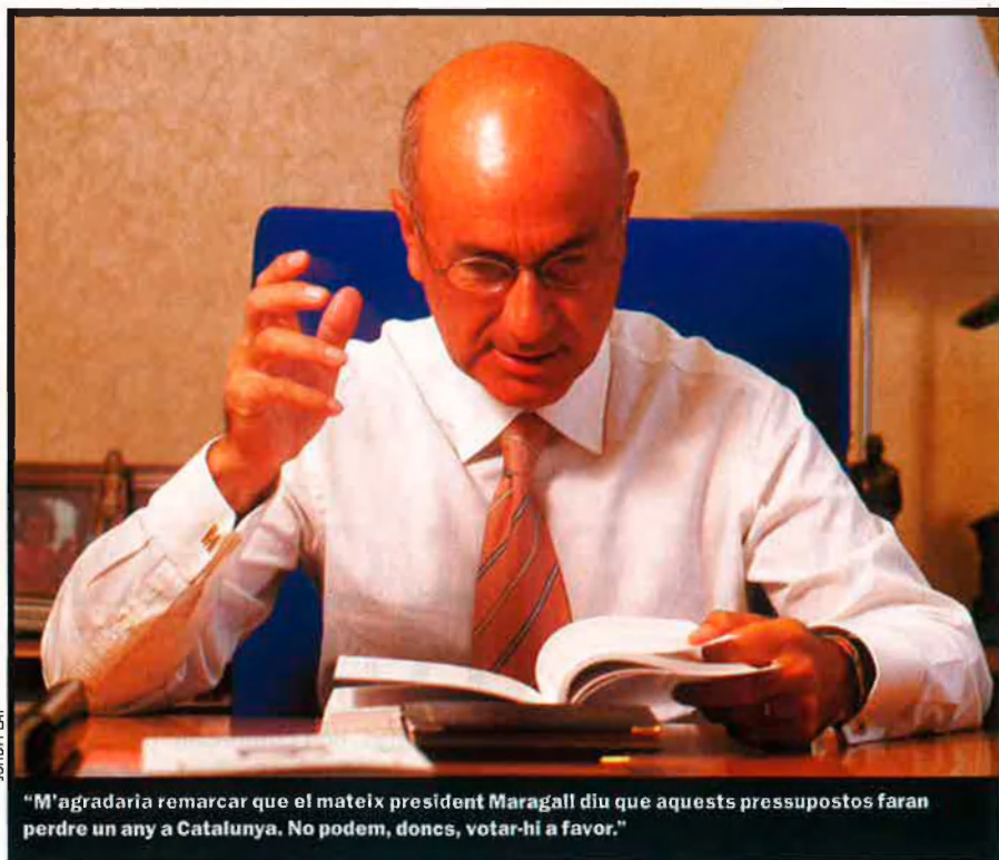
"M'agradaria remarcar que el mateix president Maragall diu que aquests pressupostos faran perdre un any a Catalunya. No podem, doncs, votar-hi a favor."

— Esquerra sabrà què ha fet a Madrid i ara sabrà què és tenir responsabilitats de Govern. Per tant, quan ens acusaven de vendre'ns per un plat de lleties... Doncs bé, si acaben aprovant aquests