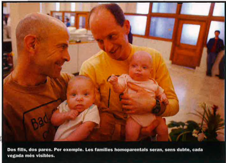
Dos fills, dos pares. Per exemple. Les famílies homoparentals seran, sens dubte, cada vegada més visibles.

Precisament, la invisibilitat ha estat –i continua sent, en grau divers– un problema bàsic en aquesta qüestió: la invisibilitat que crea qui no hi vol veure i la que genera, també, qui no vol ser vist (per provar d'evitar l'estigma i la discriminació). En tot cas, gais i lesbianes estan sortint de l'armari social. I, a mesura que ho fan, se superen prejudicis i estereotips on se'ls havia pogut col·locar: més enllà de la imatge dels locals més o menys sòrdids per al sexe clandestí (una descripció, val a dir, que igualment podríem utilitzar per als prostíbuls de clientela heterosexual), també hi ha el nucli familiar estable (o, si més no, tan estable com ho pugui ser qualsevol unió de parella). I els fills.