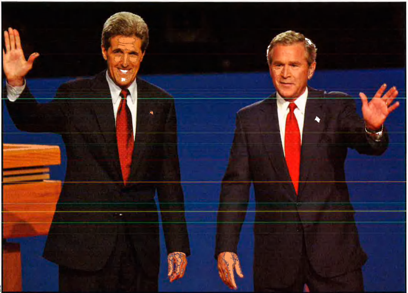
John Kerry i George W. Bush saluden el públic assistent a l'últim debat presidencial, el passat dijous 14 d'octubre. Les enquestes fetes entre aquells que van veure els tres enfrontaments televisius atorguen la victòria a Kerry. La intenció de vot, però, està molt ajustada.

Siga quin siga el tipus d'equipament utilitzat, hi ha molts pocs estats que hagen aprovat disposicions per començar automàticament un recompte, en cas de litigi. N'hi ha que preveuen una operació parcial; d'altres, una verificació generalitzada a tot el territori. N'hi ha, també, que han aprovat disposicions establint les modalitats i el moment del recompte, però, si més no a Pennsilvània, que és un estat molt disputat, no es disposa encara avui d'un sistema uniforme.