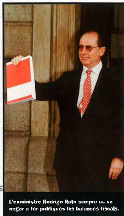
L'exministre Rodrigo Rato sempre es va negar a fer públiques les balances fiscals.

Els ministeris haurien de publicar una memòria territorialitzada de la inversió i la despesa pública