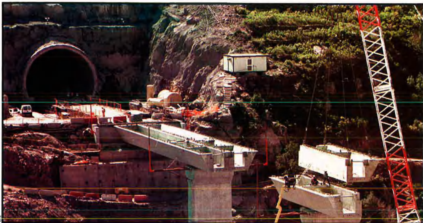
Tren d'alta velocitat a l'estat. Sense dèficit fiscal ja faria anys que funcionaria el TGV a l'eix mediterrani i que estaria connectat amb la xarxa de trens d'alta velocitat europea.