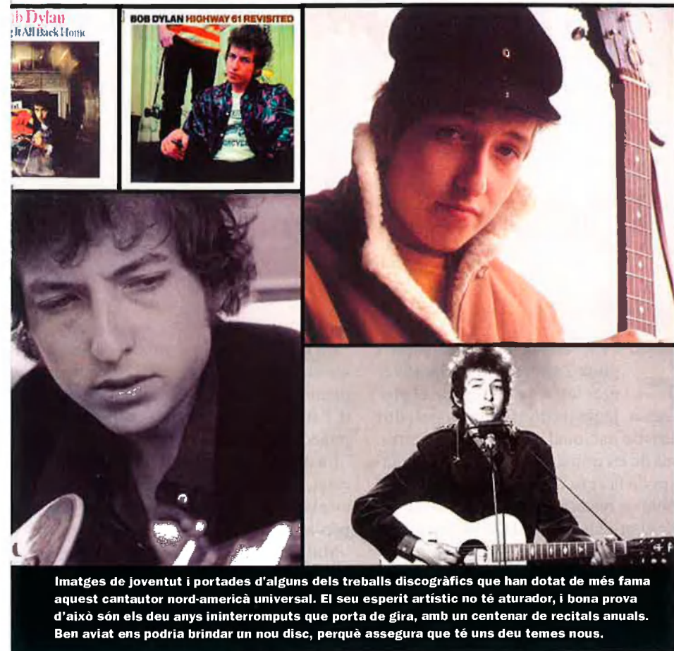
Imatges de joventut i portades d'alguns dels treballs discogràfics que han dotat de més fama aquest cantautor nord-americà universal. El seu esperit artístic no té aturador, i bona prova d'això són els deu anys ininterromputs que porta de gira, amb un centenar de recitals anuals. Ben aviat ens podria brindar un nou disc, perquè assegura que té uns deu temes nous.

ribunda reacció de la intel·lectualitat en veure'l amb la guitarra elèctrica penjada a l'espatlla va ser només l'inici d'un camí tortuós, que recentment ha tornat a generar polèmica –i notables enrabiades, tal com mostren els centenars de fòrums internautes dedicats al cantant de Duluth–, amb l'anunci televisiu que l'artista, sempre contrari a cedir drets per a publicitat, ha rodat per... a la marca de llenceria fina Victoria's Secret!