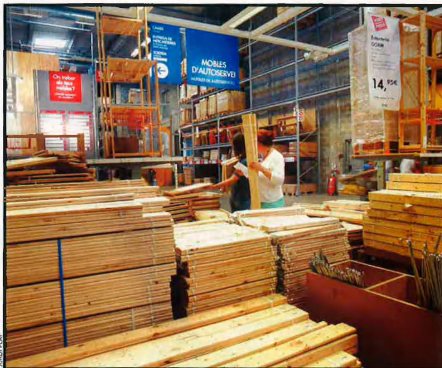
Ikea ha fet famosos els paquets plans amb què ven els mobles desmuntats. El transport i el muntatge són cosa del client i la seva perícia amb l'omnipresent clau Allen.

Així, si res no ho atura, València també tindrà una macrobotiga d'aquestes que es compten per uns quants milers de metres quadrats, on es mostren les diverses estances d'un pis amb els mobles corresponents, pel mig hi ha el restaurant, i que s'acaba amb l'espai dels complements, el magatzem on s'agafen els paquets plans i la caixa. Un cop hi entres has d'anar seguint tot el recorregut fins al final. Si és dissabte o festiu la cua que has trobat en els accessos exteriors es repeteix a dins. Potser per compensar tantes esperes, Ikea t'ho agraeix posant a l'abast del client tot tipus de fòtils molt barats, de manera que si no has comprat cap moble, per un euro