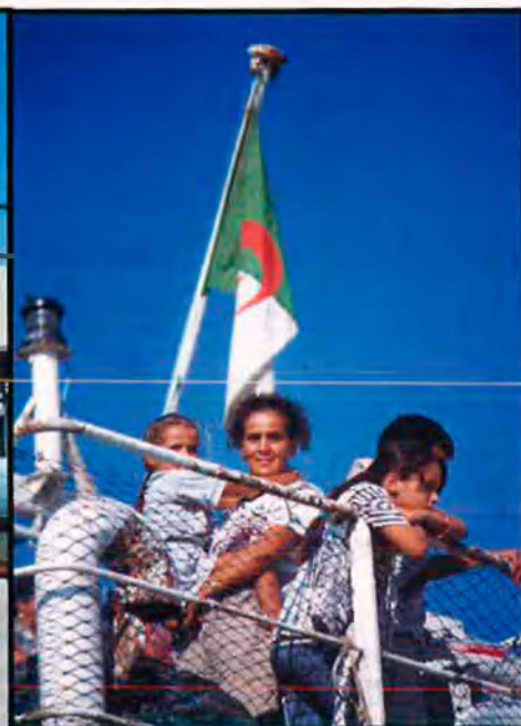
Movimiento por la Democracia en Argèlia (M.D.A.)