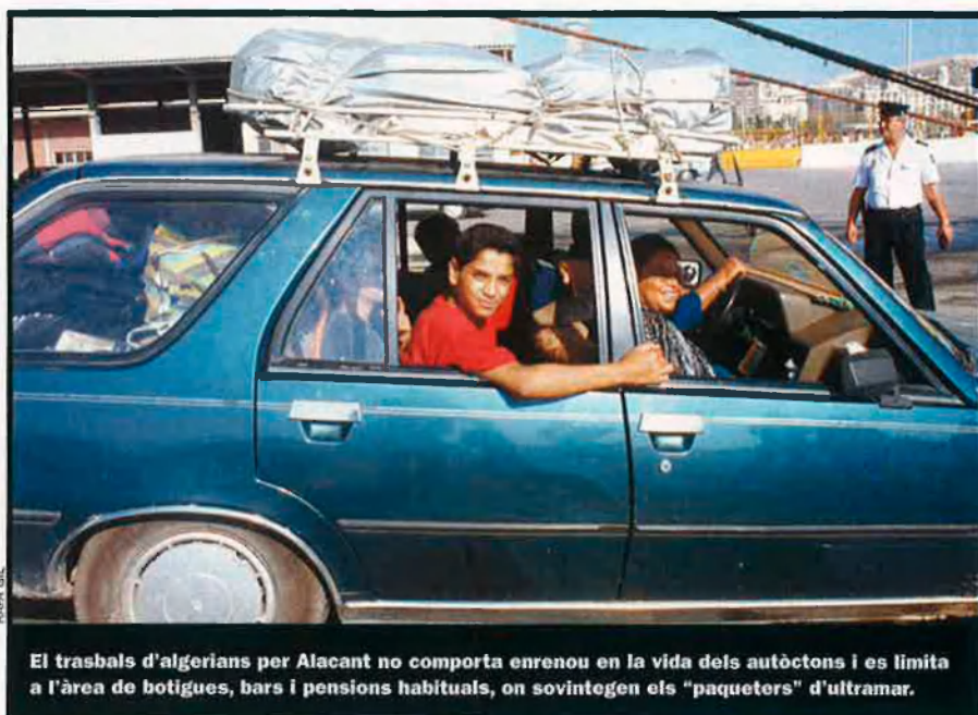
El trasbals d'algerians per Alacant no comporta enrenou en la vida dels autòctons i es limita a l'àrea de botigues, bars i pensions habituals, on sovintegen els "paqueters" d'ultramar.

En aquestes primeres onades migratòries destaquen els menorquins, que, foragitats de llur illa per la precària situació econòmica, formaren un grup força cohesionat. Establerts sobretot a l'Algerois, els maonesos fundaren la ciutat de Fort-de-l'Eau (Bordj el-Kiffan, segons la nomenclatura actual) i conservaren