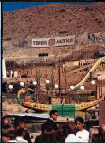
Dalt, el colossal Palau de les Arts, que encara tardarà a acabar-se i que estarà dedicat a l'òpera. A sota, Consuelo Ciscar i Terra Mítica, dos símbols de l'era Zaplana.

ponsables han pagat gairebé un milió d'euros a dues empreses per la mateixa cosa: un estudi sobre el model de negoci que ha de posar en pràctica la Ciudad de la Luz. Les perspectives semblen nefastes per a una Generalitat que ara mateix s'ha convertit gairebé en accionista única d'aquest invent.