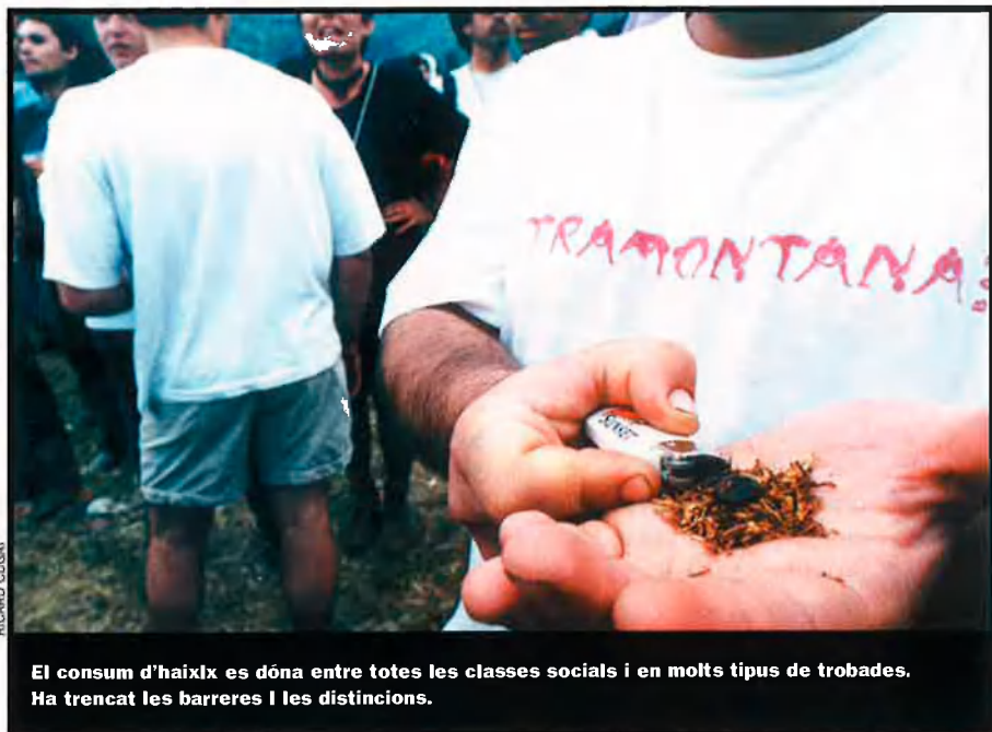
El consum d'haixix es dóna entre totes les classes socials i en molts tipus de trobades. Ha trencat les barreres i les distincions.

com a substitut de l'andalús, molt més vigilat.