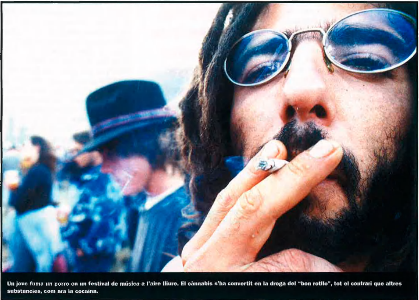
Un jove fuma un porro en un festival de música a l'aire lliure. El cànnabis s'ha convertit en la droga del "bon rotlló", tot el contrari que altres substàncies, com ara la cocaïna.

conegut al carrer com costo o xocolata , és una matèria bastant més rica en canabinoides que la marihuana.