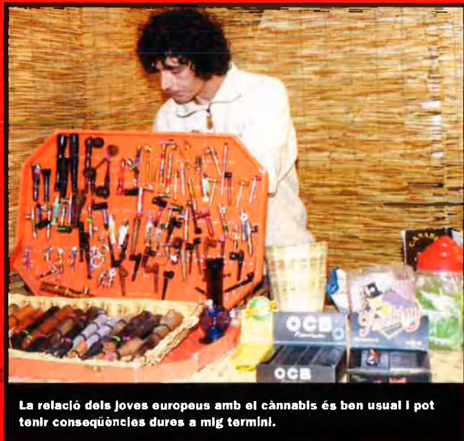
La relació dels joves europeus amb el cànnabis és ben usual i pot tenir conseqüències dures a mig termini.

Qui ha arribat aquí rep les atencions d'un equip de metges, educadors, pedagogs socials, infermers, encaregats