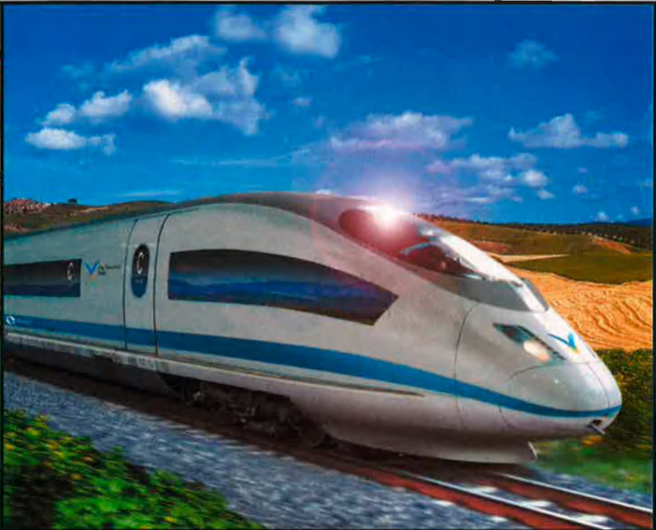
L'AVE que ha d'unir Madrid i el País Valencià com a molt prompte no estarà fins al 2007, tot i que el PP va arribar a parlar del 2010. Al costat, el traçat que encara mantenen des de Foment.