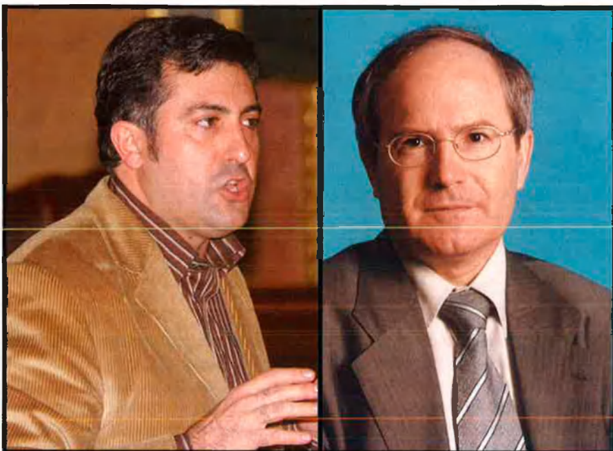
El secretari general d'ERC, Joan Puigcercós, i el ministre d'Indústria i primer secretari del PSC, José Montilla, ja van mantenir negociacions per pactar el Govern tripartit. A sota, els responsables d'economia dels executius català i espanyol: Antoni Castells i Pedro Solbes.