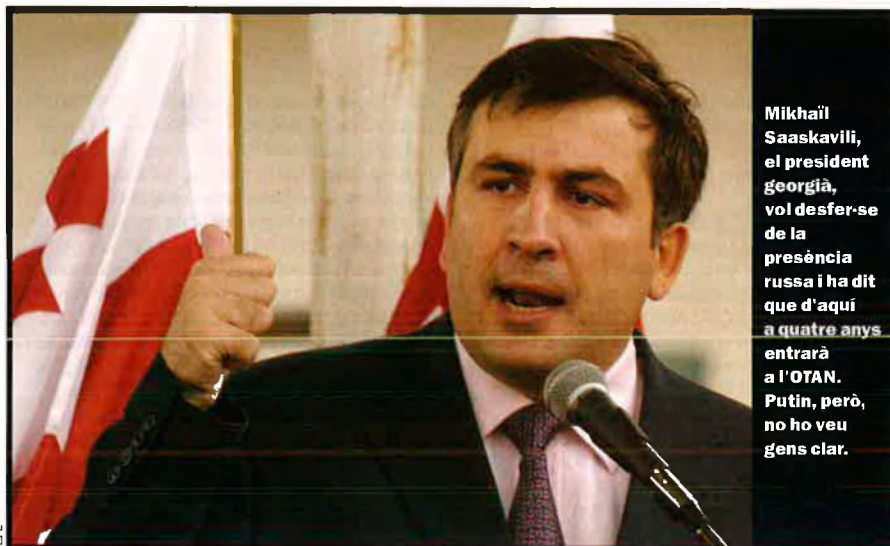
Mikhaïl Saaskavili, el president georgià, vol desfer-se de la presència russa i ha dit que d'aquí a quatre anys entrarà a l'OTAN. Putin, però, no ho veu gens clar.

de tot tipus de tràfics. De nou es van independitzar Armènia, Azerbaidjan i Geòrgia. Per la seva banda, els moviments independentistes al Caucas nord el 1991