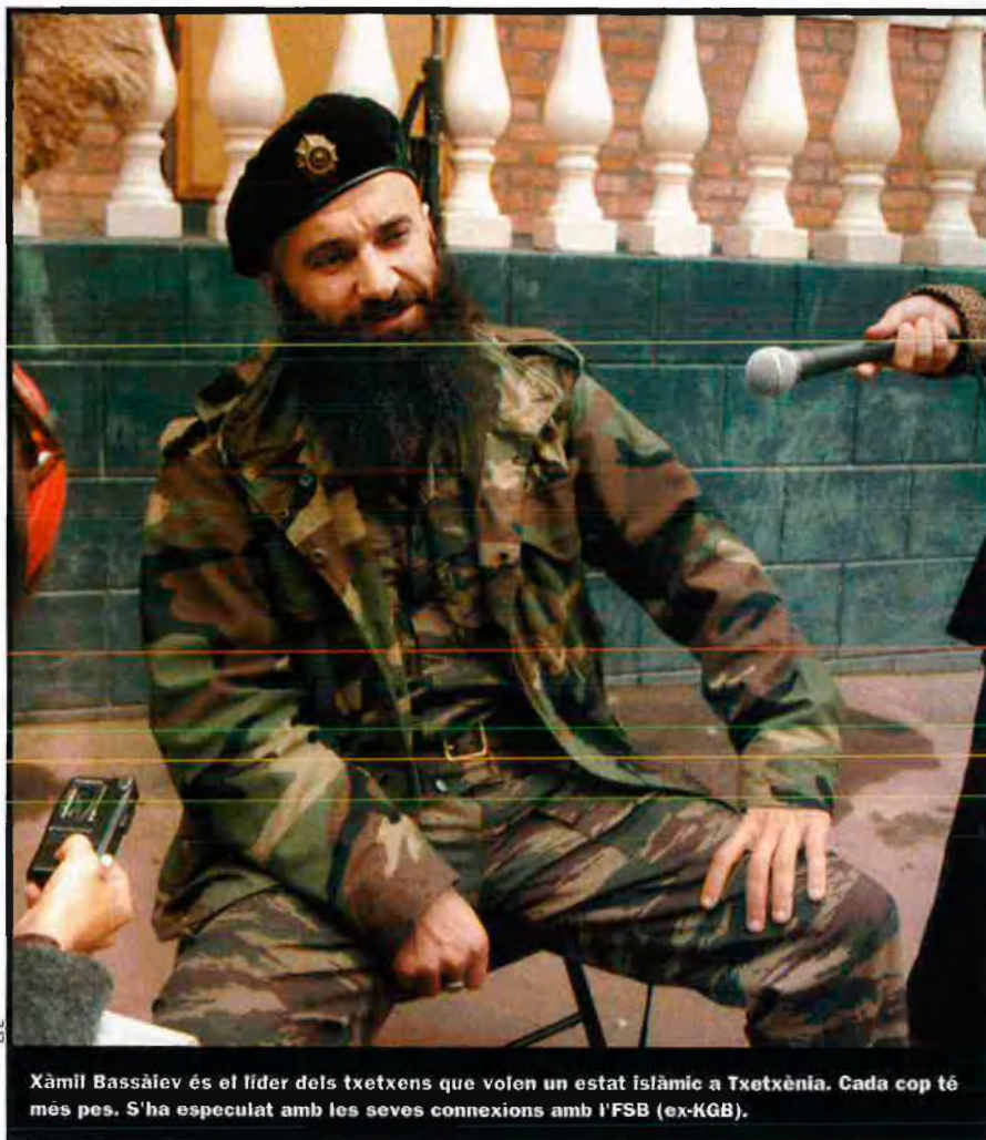
Xàmil Bassàiev és el líder dels txetxens que volen un estat islàmic a Txetxènia. Cada cop té més pes. S'ha especulat amb les seves connexions amb l'FSB (ex-KGB).

lonial, ha esdevingut, marcat per nous signes, un escenari de la lluita contra el terrorisme internacional. Des dels atemptats als Estats Units del setembre de 2001, Putin, sota la bandera d'una aliança mundial contra els extremistes islàmics, dirigia una sagnant lluita contra els txetxens, sense perspectives, per la integritat territorial de Rússia.