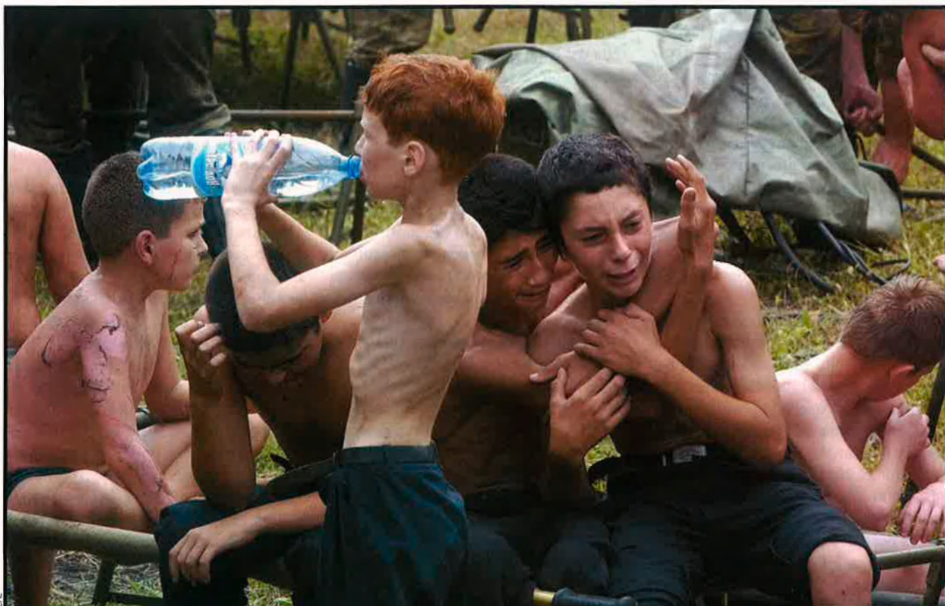
Les imatges d'infants mig despullats, aterrits per la mort, marquen una nova etapa en la lluita a Txetxènia, acaparada ara pels sectors connectats amb l'islamisme radical.

Un caòtic cop d'alliberament ha marcat el sagnant inici d'una nova etapa en el terrorisme internacional: la guerra contra els infants a les escoles. L'atemptat més cruel des de l'11 de setembre de 2001 demostra que els islamistes dirigeixen la rebel·lió txetxena contra Moscou.