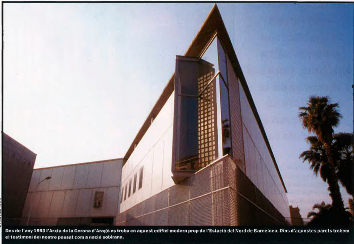
Des de l'any 1993 l'Arxiu de la Corona d'Aragó es troba en aquest edifici modern prop de l'Estació del Nord de Barcelona. Dins d'aquestes parets trobem el testimoni del nostre passat com a nació sobirana.

Grassa, de l'any 844, o una escriptura privada original de l'any 889. També cal destacar la butlla en paper que Silvestre II atorgà al monestir de Sant Cugat el 1003 o la de Joan XVIII de l'any 1008. No hem d'oblidar la sèrie de pergamins, amb documentació estrictament catalana, des de Guifré I el Pilós fins a Ramon Berenguer IV.