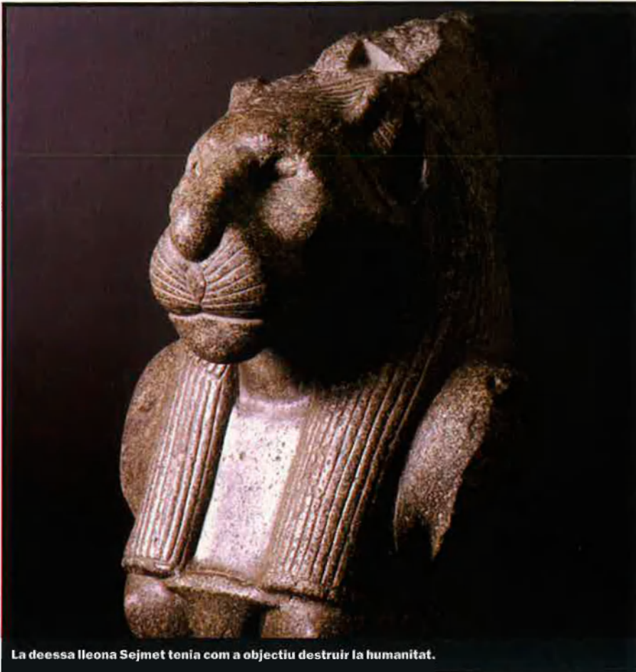
La deessa lleona Sejmet tenia com a objectiu destruir la humanitat.

unes privilegiades si les comparem amb altres civilitzacions, com la grega o la romana o, fins i tot, amb la situació que viuen avui dia les dones a Egipte o a altres països.