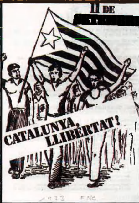
Publicació falangista amb la imatge de la bandera manipulada al transbordador del Port de Barcelona, el 1944. A sota, l'estàtua de Rafael Casanova amagada i convocatòria del FNC el 1973.