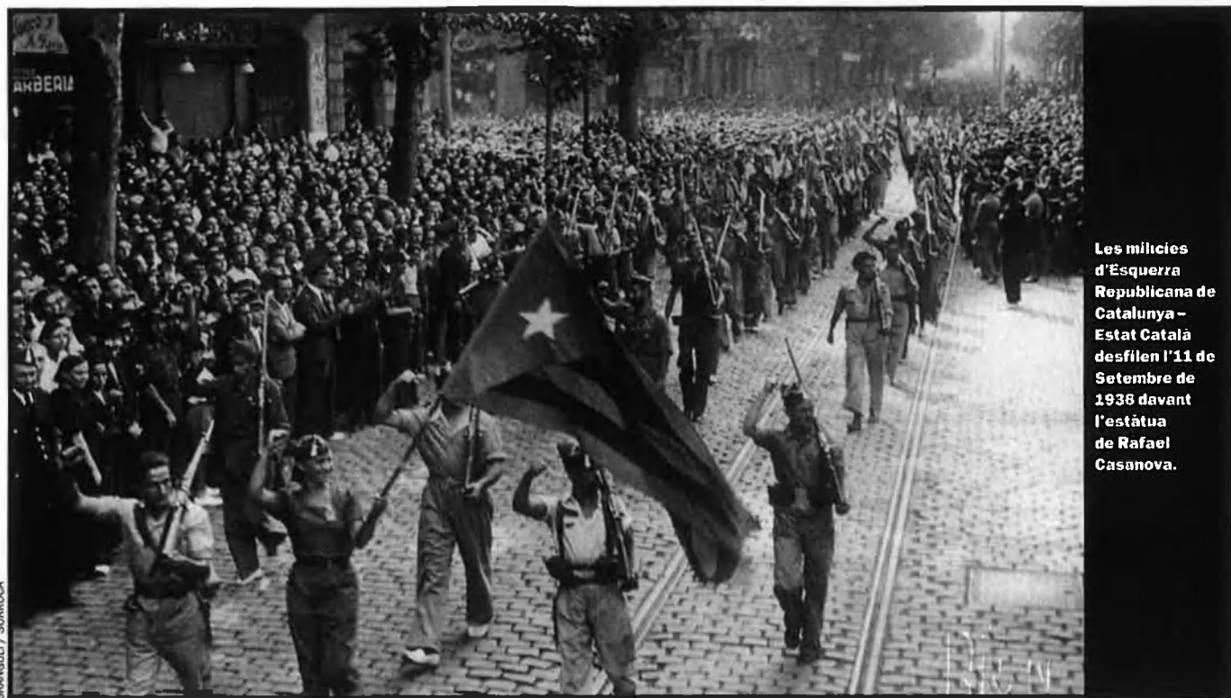
Les milícies d'Esquerra Republicana de Catalunya - Estat Català desfilen l'11 de Setembre de 1938 davant l'estàtua de Rafael Casanova.

Però si bé la repressió va actuar amb tota celeritat, també l'esperança i el coratge es van manifestar tot seguit. Acabaven de treure el monument quan unes mans anònimes van deixar-hi una còpia minúscula de l'estàtua amb una cartell que deia: "Ja creixeràs."