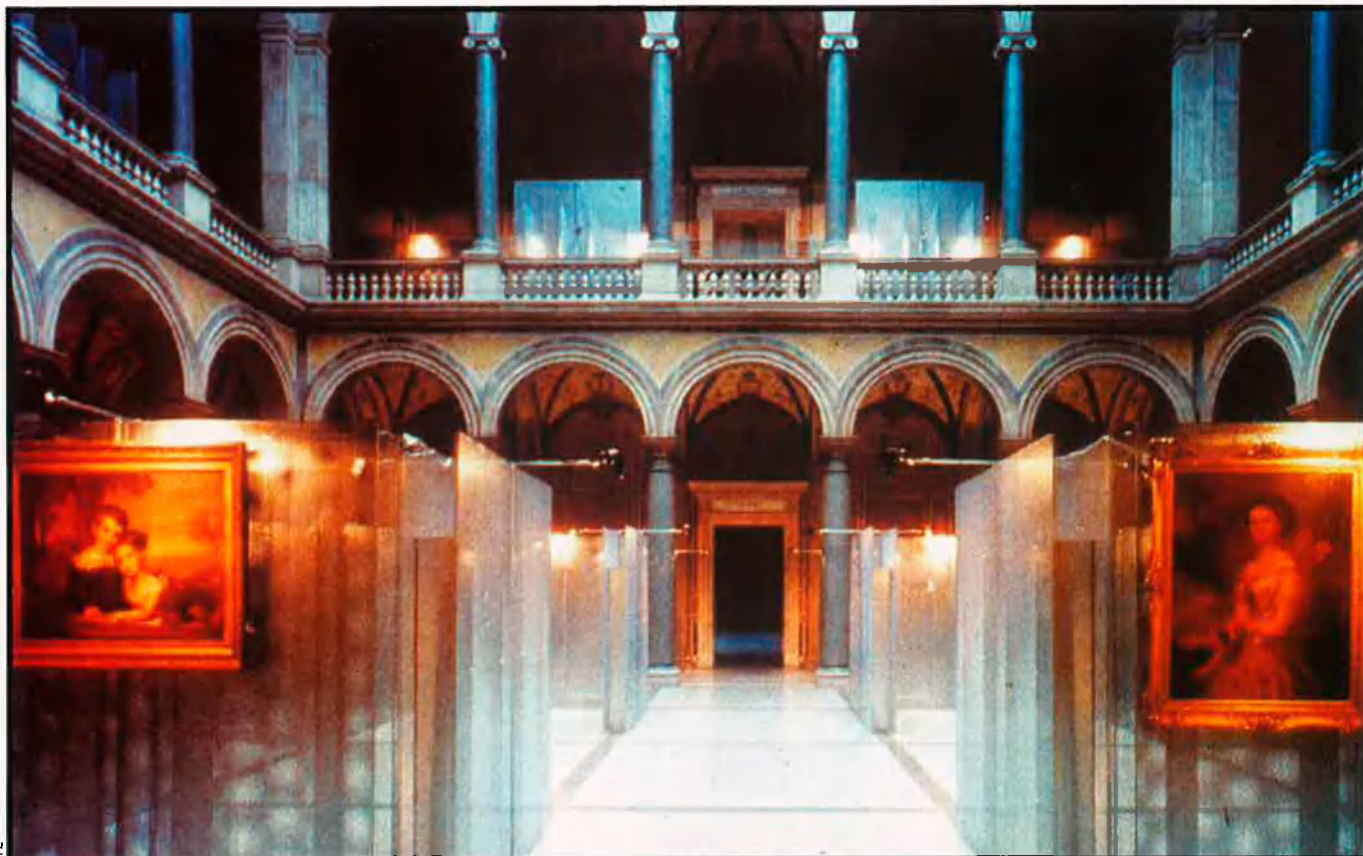
Exposició a Viena d'obres d'art que els nazis van confiscar a famílies jueves. Després, les obres seran subhastades per compensar els hereus dels antics propietaris.

de l'actriu sostenen que hi ha proves concloents per demostrar que la família havia venut les obres d'art per finançar la seva emigració a Sud-àfrica, i que la Taylor havia adquirit el Van Gogh en una subhasta de Sotheby's el 1963.