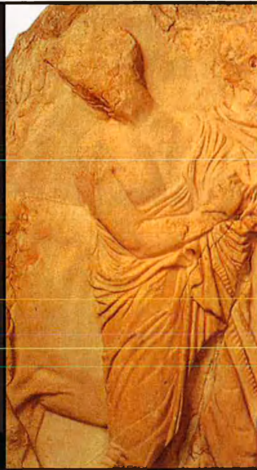
Elizabeth Taylor té un quadre de Van Gogh que, presumptament, va ser espollat pels nazis a la família jueva Maulhner. A la dreta, escultures de la Grècia clàssica que foren espollades.

que sembla. Perquè d'armes i de drogues, fins i tot de prostitució i tràfic d'immigrants, tothom, més o menys, en sap, però l'art és una matèria força volàtil.