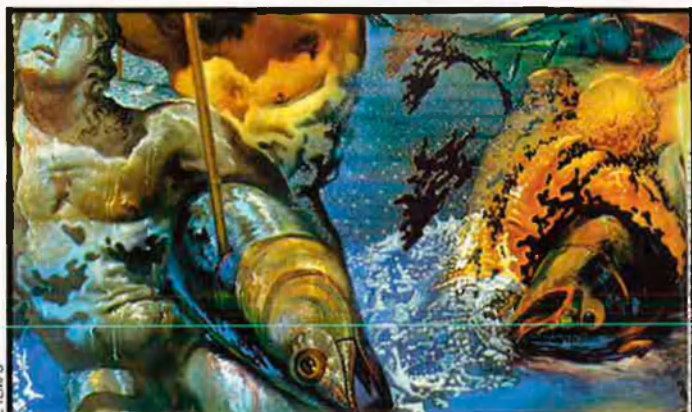
Detall d'una obra de Dalí, La pesca de la tonyina , que fou robada el 1973. El 1978, els lladres la van abandonar: massa coneguda per trobar comprador.

seus són per a tothom i on sembla que a ningú li passa pel cap que es produeixin robatoris. Una de les quatre versions d'aquesta obra, fou robada el 1994 a la Galeria Nacional d'Oslo mitjançant una espectacular i ràpida operació en la qual els lladres trigaren cinquanta segons en fer-se amb la única obra que s'endugueren. Les investigacions conduïren a la detenció de Paul Enger, condemnat tan sols a sis anys de presó per aquest fet.