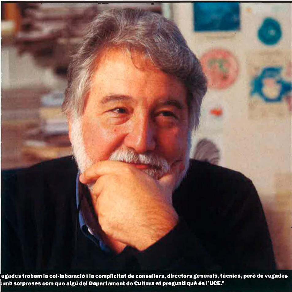
vegades trobem la col·laboració i la complicitat de consellers, directors generals, tècnics, però de vegades amb sorpreses com que algú del Departament de Cultura et preguntí què és l'UCE."

fessors, per exemple. Un professor acostuma a cobrar dos mesos abans de tornar a fer les classes a Prada. Però hi ha tipus de despeses que no poden esperar: subministraments, cuina, el sou de la gent que treballa... Seria molt trist que Prada es morís per inanició econòmica i no pels motius que dèiem abans.