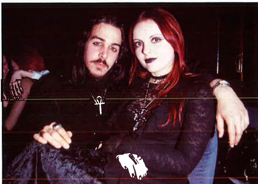
Els joves gòtics reivindiquen un culte estètic rupturista, que fa de l'adoració als símbols pagans i prohibits una mostra de la seua fúria contra les convencions establertes.