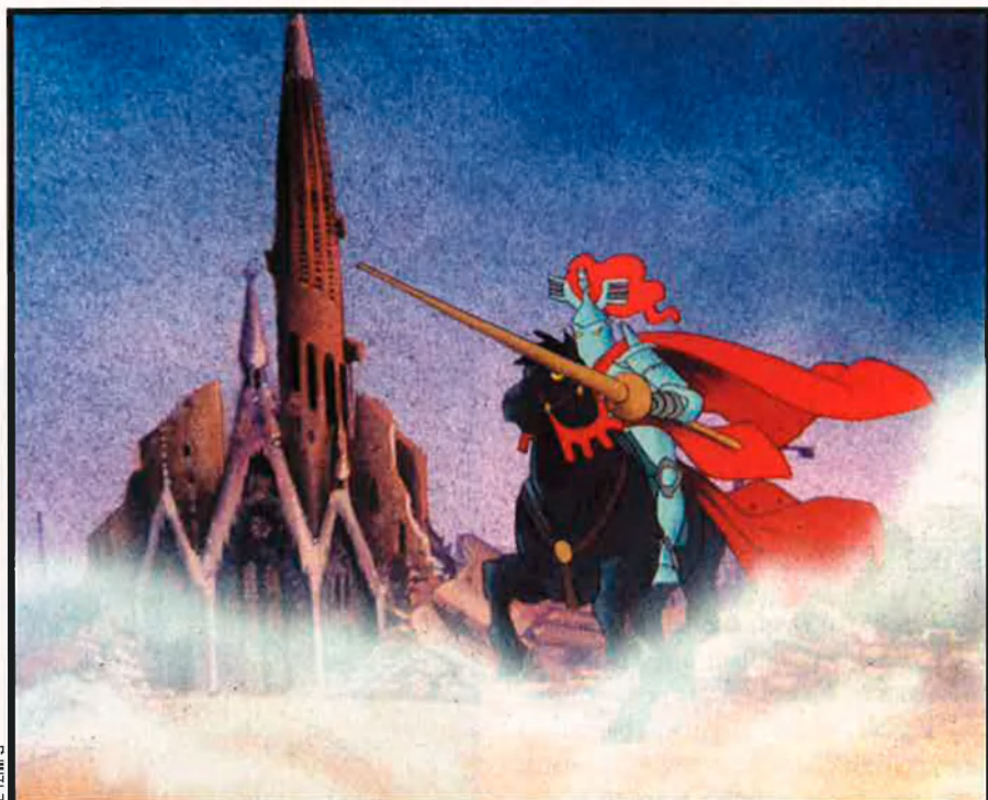
L'animació tradicional ha deixat al nostre país obres tan meritòries com Despertaferro (1990), de Jordi Amorós. Ara la continuïtat d'aquest patrimoni està amenaçada.