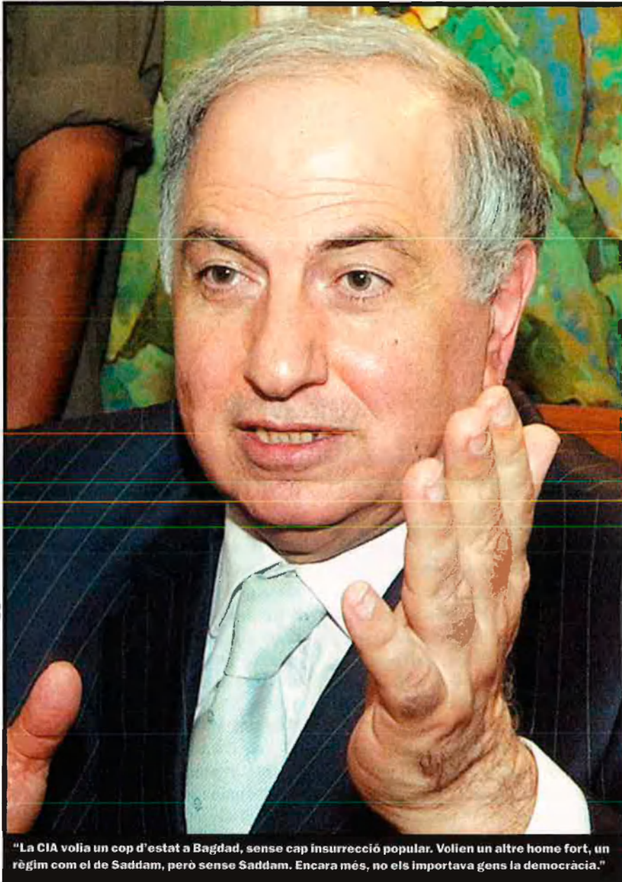
"La CIA volia un cop d'estat a Bagdad, sense cap insurrecció popular. Volien un altre home fort, un règim com el de Saddam, però sense Saddam. Encara més, no els importava gens la democràcia."

— Efectivament, l'any 1996, la CIA intentà organitzar un cop d'estat a Bagdad.