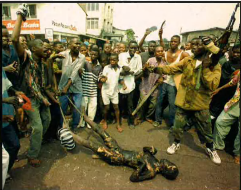
A l'esquerra, guerrillers patrullant una població de la regió congolese de Kivu. A la dreta, una de les escenes de crueltat sense límits entre hutus i tutsis. Les víctimes de la guerra que assola des de fa una dècada Ruanda i la República Democràtica del Congo es compten per milions.

més curt possible. Uns quants minuts després, les màquines inicien el viatge de tornada. Mentrestant, una fila inacabable de camions desmanegats, cadascú carregat amb deu barrils de 700 quilos de coltan, surten cap a Ruanda i després van en direcció Dar es Salaam, a Tanzània, on la càrrega s'embarcarà cap a Europa.