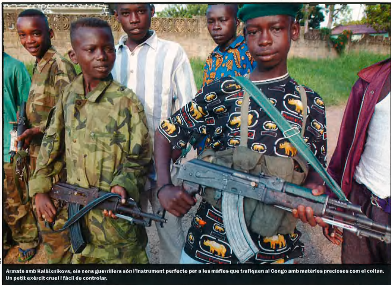
Armats amb Kalàixnikovs, els nens guerrillers són l'instrument perfecte per a les màfies que trafiquen al Congo amb matèries precioses com el coltan. Un petit exèrcit cruel i fàcil de controlar.

rèixer en algun lloc entre uns fronts incomprensibles per als profans.