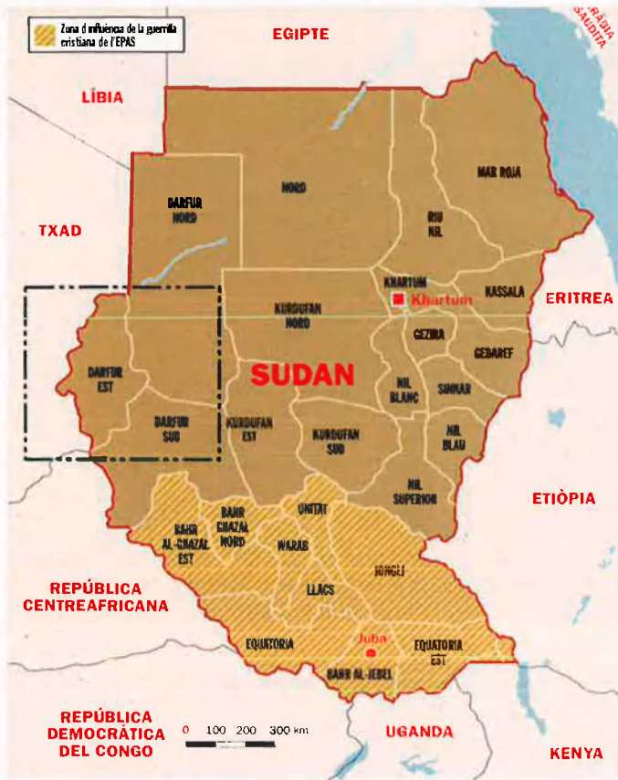
Gràfic: V. PRIETO