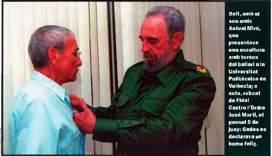
Dalt, amb el seu amic Antoni Miró, que presentava una escultura amb torsos del ballari a la Universitat Politècnica de València; a sota, rebent de Fidel Castro l'Ordre José Martí, el passat 5 de Juny; Gades es declarava un home feliç.

desdir, del que pensava: quant a existir, "existeix la cultura catalana, i la basca, i la gallega... però d'aquestes cultures no se'n pot fer un esperanto".