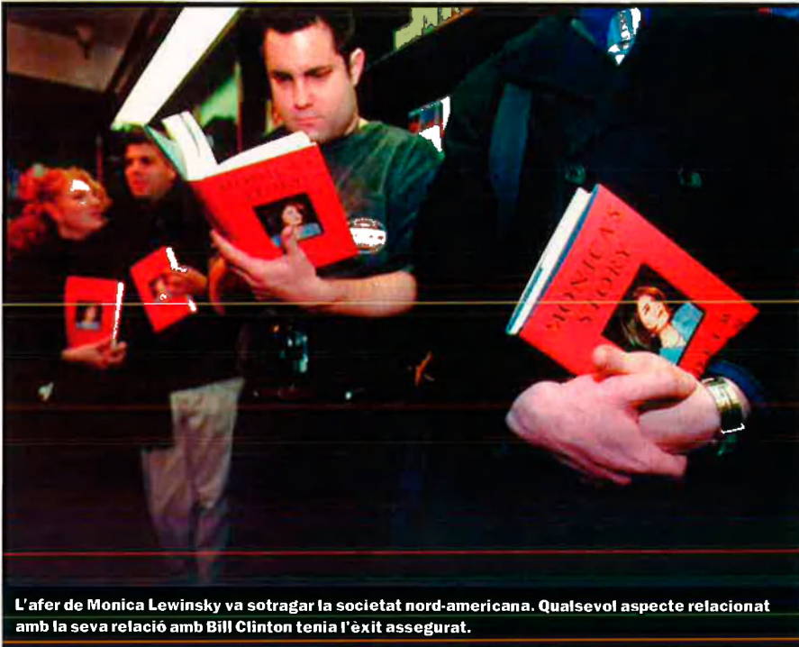
L'afer de Monica Lewinsky va sotragar la societat nord-americana. Qualsevol aspecte relacionat amb la seva relació amb Bill Clinton tenia l'èxit assegurat.

americana en relació amb el sexe. Qui estigui lliure de pecat, que tiri la primera pedra: no hi ha la mateixa hipocresia, a Europa? Possiblement el lector pensarà que no. Però avaluem dos casos ocorreguts la setmana passada, el dimecres.