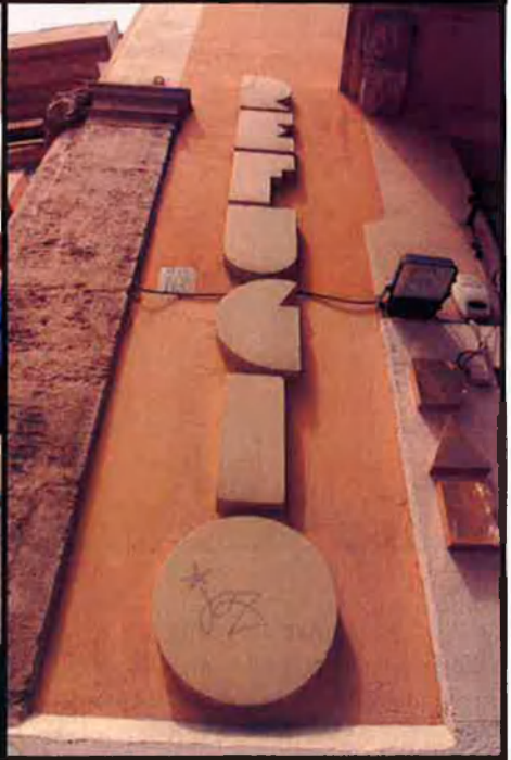
Diversos anuncis de refugis de la guerra que encara es conserven al centre de València. Aquests cartells d'art-déco, amb la seua contundent tipografia, formen part de la imatge urbana de València i són un record mut de la conflagració que va convulsionar la ciutat fa més de seixanta anys.

cionament i protecció que feien els mateixos veïns a les seues cases, als soterranis de grans edificis o a les fàbriques confiscades. Fer un còmput d'aquests darrers és molt més difícil, ja que alguns