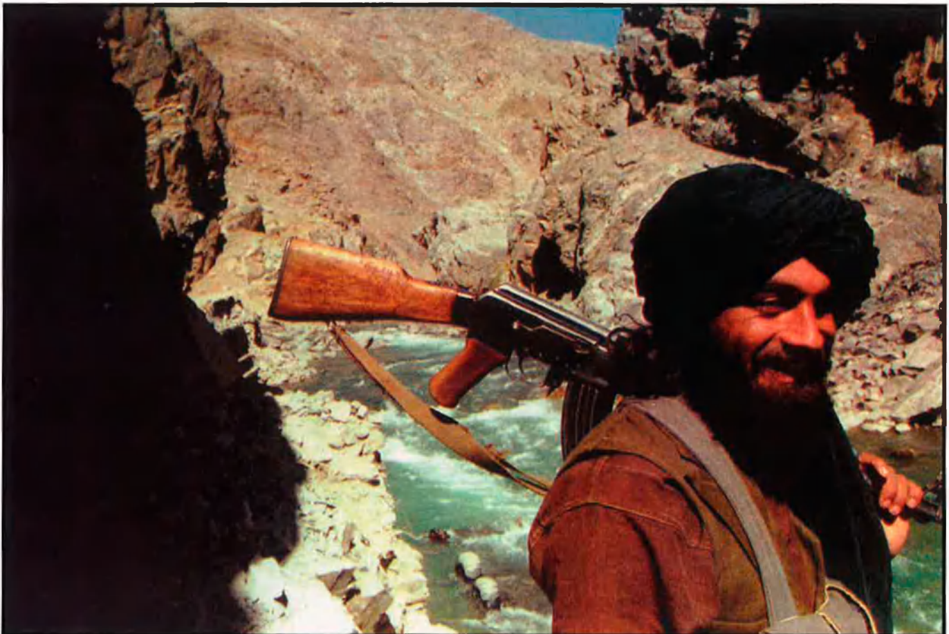
Els talibans de l'Afganistan han tractat sempre de forma brutal els homosexuals. Fa sis anys dos joves foren condemnats a morir aixafats per un mur derrocat per una excavadora a la ciutat d'Herat, davant una multitud exaltada.

altra de diferent, però, la vida quotidiana. Sense oblidar els comportaments de poetes i sultans en llur fascinació per l'efebus, el personatge del bell adolescent masculí, efeminat, promès per l'Alcorà a tot aquell que assoleixi el paradís, que ha justificat certs comportaments il·lícits —a ulls de la religió— entre els notables de la societat.