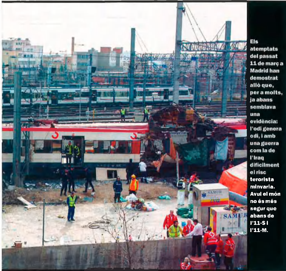
Els atemptats del passat 11 de març a Madrid han demostrat allò que, per a molts, ja abans semblava una evidència: l'odi genera odi, i amb una guerra com la de l'Iraq difícilment el risc terrorista minvaria. Avul el món no és més segur que abans de l'11-S i l'11-M.

situació del conflicte entre palestins i israelians. De fet, després de moltes dècades de retòrica i de poses marcial, el món arabomusulmà (és a dir, uns 1.500 milions de persones) està, per primera vegada, realment mobilitzat contra Israel i a favor de la destrucció de l'estat jueu al Pròxim Orient. L'odi, que fins ara només es palesava en paraules, ha començat a fer-se real i tangible. Molts joves musulmans consideren avui dia la destrucció d'Israel un objectiu desitjable, cosa que no passava abans. Israel ha gaudit de molta seguretat militar, però la pressió que ha exercit darrerament té dues explicacions: d'una banda, la fuga de capital israelià cap als mercats estrangers més segurs, i de l'altra, la fugida (o, en terminologia sionista, la yorda , o descens, per oposició a l' aliya , ascens) d'una proporció significativa de població israeliana cap a Occident.