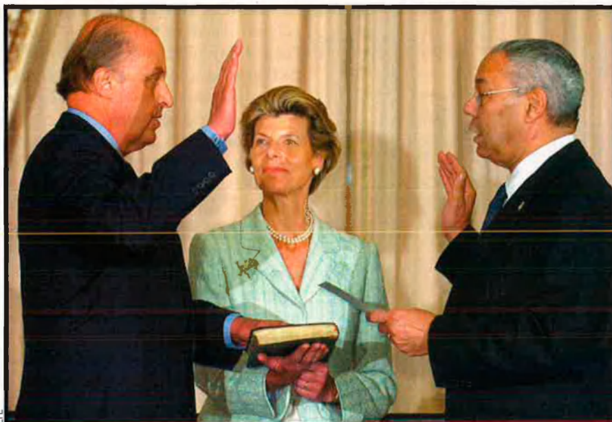
El nomenament de John Negroponte com a ambaixador dels Estats Units a l'Iraq -a la imatge, jura el càrrec davant el secretari d'Estat, Colin Powell- no és un missatge gaire encoratjador.

dentment de qui ocupe la Casa Blanca, ja siga George W. Bush o John Kerry. A Washington, les esferes dirigents sembla que visquen aïllades, o endutes per l'angoixa; les autoritats polítiques a Bagdad i, especialment, Paul Bremer, es tanquen al búnquer; tota la iniciativa parteix dels caps militars (els generals Myers, Abizaid i Kimmitt), mentre que, a Fal-luja, la gestió de la situació està en mans, segons sembla, dels oficials de la marina locals, que no tenen ni idea de les necessitats polítiques o diplomàtiques.