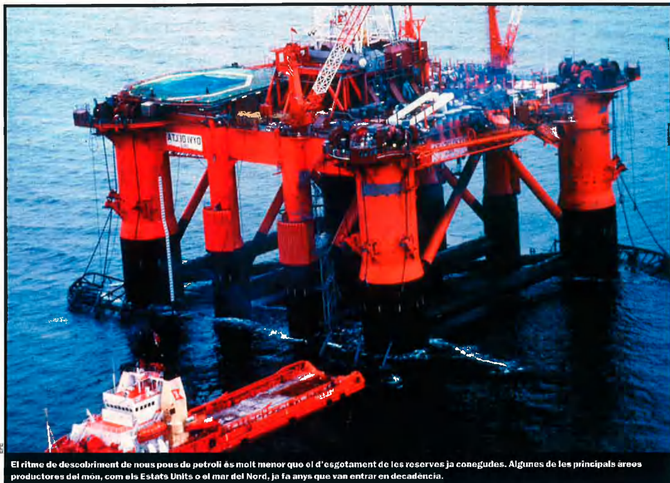
El ritme de descobriment de nous pous de petroli és molt menor que el d'esgotament de les reserves ja conegudes. Algunes de les principals àrees productores del món, com els Estats Units o el mar del Nord, ja fa anys que van entrar en decadència.