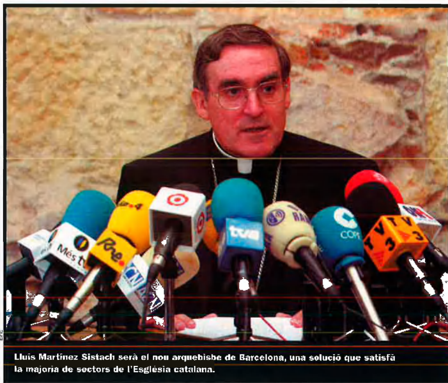
Lluís Martínez Sistach serà el nou arquebisbe de Barcelona, una solució que satisfà la majoria de sectors de l'Església catalana.

les queixes de diversos col·lectius de seglars i capellans contra la possibilitat que Pujol passés directament de capellà a titular d'un dels arquebisbats amb més fidels, poder i diners, va frenar aquesta opció.