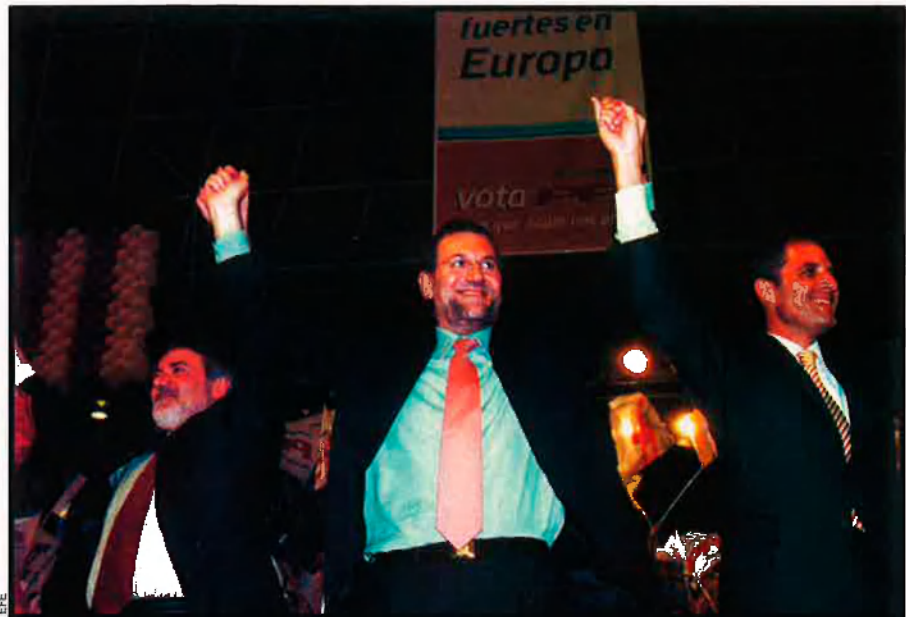
Imatge del míting que el PP va celebrar al velòdrom Lluís Puig de València durant la campanya electoral de les eleccions europees. D'esquerra a dreta, Mayor Oreja, Rajoy i Camps.

Esquerra Unida del País Valencià i el Bloc Nacionalista Valencià també han patit fracassos abassegadors, encara que de diversa magnitud. EUPV, d'una banda, ha obtingut 58.000 vots, el 3,3%, els pitjors resultats de la seua història amb molta diferència, un suport electoral que s'afegeix a la contínua davallada electoral de la coalició d'esquerra i que qüestiona seriosament la seua viabilitat futura com a projecte autònom que pugua tornar a superar el 5% dels vots necessaris per a entrar a les Corts Valencianes. Després de les eleccions europees es reobre amb més força la lluita interna entre els dos sectors enfrontats des de l'assemblea de la coalició del passat mes de desembre: el que encapçala l'actual coordinadora general, Glòria Marcos, que va arribar al càrrec després de la segona volta i que té el suport d'una part del partit comunista i dels independents; i el de Pasqual Mollà, del corrent nacionalista Esquerra i País, que va guanyar la primera volta del conclave, amb tres candidats, i que lidera la família més nombrosa de la coalició, que representa un terç de l'organització. Esquerra i País demana una nova assemblea extraordinària per assumir el lideratge de l'organització i dur a terme el seu gran projecte històric: una confluència de les forces nacionalistes i d'esquerra valencianes. Si no canviaren