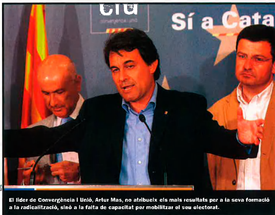
El líder de Convergència i Unió, Artur Mas, no atribueix els mals resultats per a la seva formació a la radicalització, sinó a la falta de capacitat per mobilitzar el seu electorat.