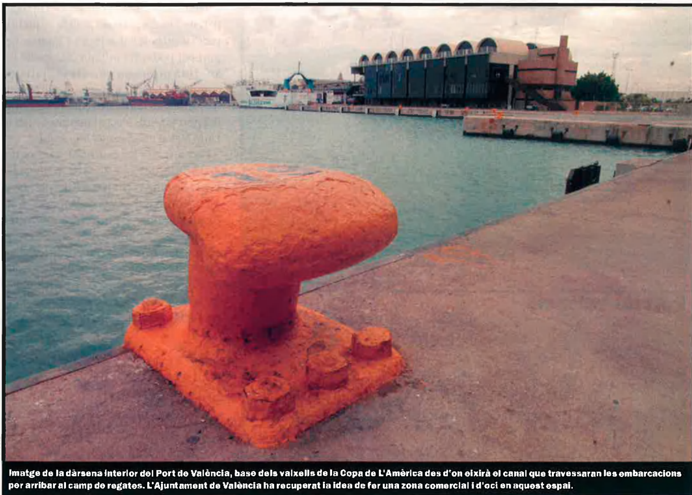
Imatge de la dàrsena interior del Port de València, base dels valxells de la Copa de L'Amèrica des d'on eixirà el canal que travessaran les embarcacions per arribar al camp de regates. L'Ajuntament de València ha recuperat la idea de fer una zona comercial i d'oci en aquest espai.

terior del Port de València, la més històrica d'aquesta instal·lació, en una zona comercial i d'oci oberta als ciutadans, una idea que concreta un antic projecte de l'Ajuntament de València, l'anomenat Balcó al Mar.