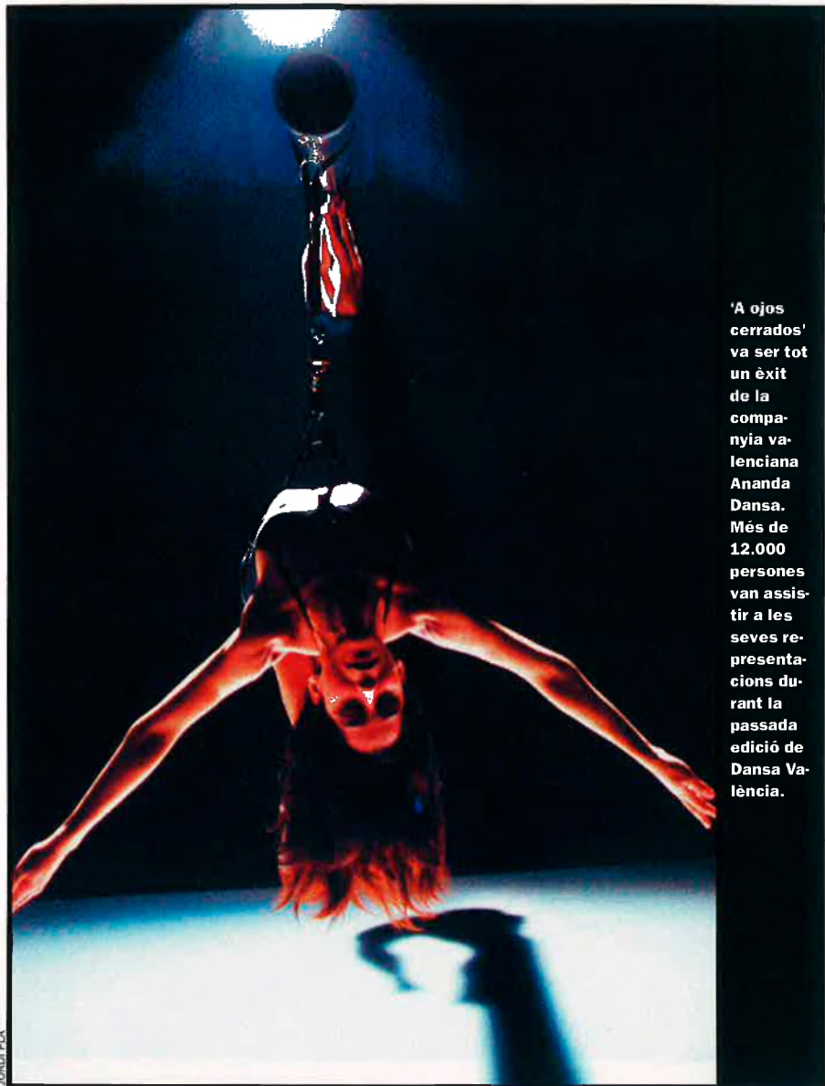
'A ojos cerrados' va ser tot un èxit de la companyia valenciana Ananda Dansa. Més de 12.000 persones van assistir a les seves representacions durant la passada edició de Dansa València.