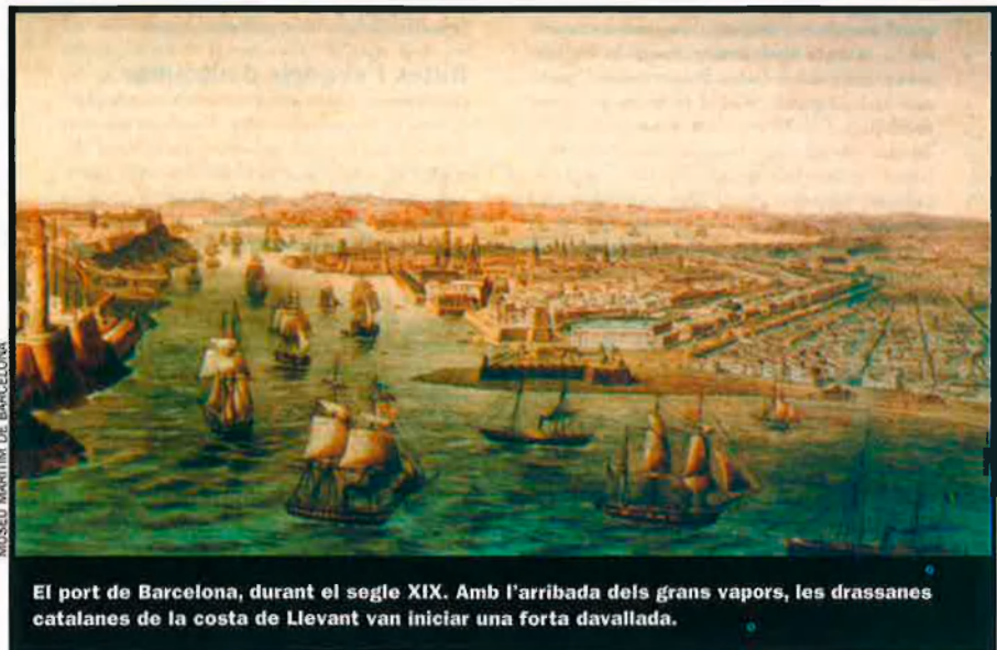
El port de Barcelona, durant el segle XIX. Amb l'arribada dels grans vapors, les drassanes catalanes de la costa de Llevant van iniciar una forta davallada.

Però no només de xifres i comerç parla el llibre. De manera indirecta, es fa la història de l'aiguarent i del vi d'alta graduació, que era el català, molt preuat. I es recorda que la popularització de l'aiguarent com a beguda va ser