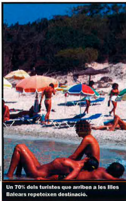
Un 70% dels turistes que arriben a les Illes Balears repeteixen destinació.