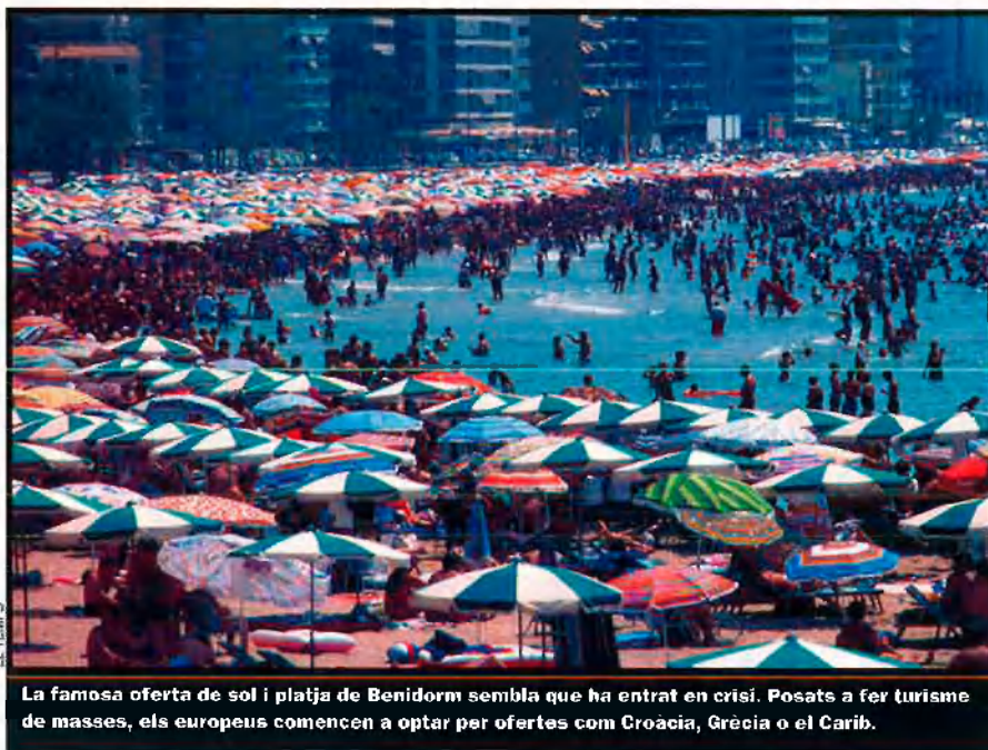
La famosa oferta de sol i platja de Benidorm sembla que ha entrat en crisi. Posats a fer turisme de masses, els europeus comencen a optar per ofertes com Croàcia, Grècia o el Carib.

Benidorm, està en crisi”, sentència Oto Luque, director de la Fundació Cavanilles d’Alts Estudis Turístics, de la Universitat de València. Posa un exemple certament irrefutable. El majorista de viatges alemany TUI ha deixat d’operar des d’enguany a la Costa Blanca, costa d’Alacant. Era un servidor d’important quantitat de turistes. El resultat no és difícil d’imaginar: caiguda en picat del turisme alemany cap a la zona. Els hotelers estan espantats. Els senyal d’alarma s’ha encès. La Generalitat intenta reaccionar, juntament amb els hotelers, muntant viatges de promoció turística a Düsseldorf i Munic, per exemple, per mirar de compensar el cop. Al mateix temps, la política més preuada és llançar balons a fora. De fet, les manifestacions últimament habituals són que el país pot estar tranquil perquè hi ha un nivell de visites i entrades econòmiques suficient gràcies al turisme espanyol i britànic. Però resulta que les notícies que arriben de Londres no són tan optimistes, ni prop fer-hi, perquè les previsions apunten a una davallada dels visitants britànics i, a més, a una baixada de la capacitat adquisitiva. “Se’ns ve a sobre un panorama que estarà marcat per una tendència a la baixa en el nombre de turistes acompanyada de la disminució de la despesa per turista”, diu Luque, que