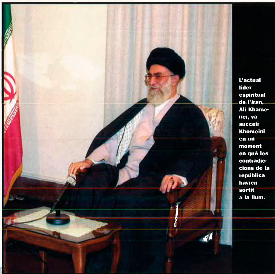
L'actual líder espiritual de l'Iran, Ali Khomeini, va succeir Khomeini en un moment en què les contradiccions de la república havien sortit a la llum.