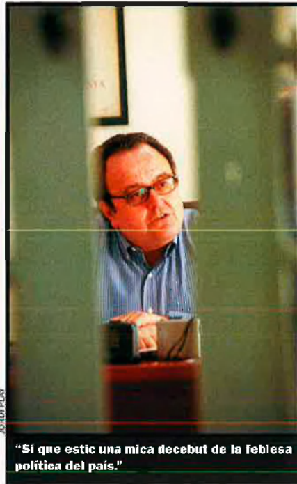
"Si que estic una mica decebut de la feblesa política del país."

Catalunya, que ha de ser l'eix de la reconstrucció nacional dels Països Catalans, té molts elements vitals. N'hi ha dos d'irrenunciables, en què no es pot retrocedir ni un mil·límetre. L'un és la immersió lingüística. L'altre, bastir un sector audiovisual català, amb una CCRTV en el paper de motor, que