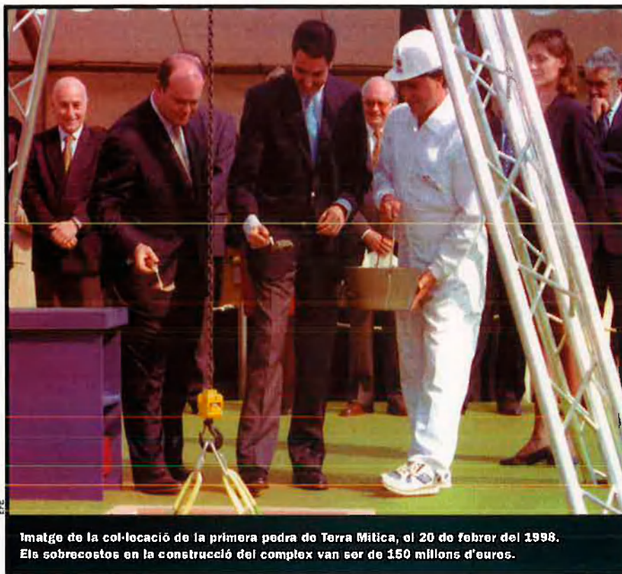
Imatge de la col·locació de la primera pedra de Terra Mítica, el 20 de febrer del 1998. Els sobrecostos en la construcció del complex van ser de 150 milions d'euros.

El desesperat acord amb Paramount. La gestió de la multinacional de l'entreteniment Paramount, que impulsa diferents parcs temàtics als Estats Units, havia de salvar el parc de la condemna al desastre que ja es veia venir, però, com si es tractara d'una maledicció, va ajudar a fer-lo irreversible. Perquè, a diferència d'Universal, que es va vincular de manera total –i això vol dir econòmica– a Port Aventura, Paramount va signar amb Terra Mítica un sever acord de gestió que no incloïa obligatòriament –només ho feia com a possibilitat– la seua participació capitalista en la societat. Tampoc considerava com a requisit la cessió d'atraccions pròpies en el primer parc que la corporació americana gestionava en Europa.