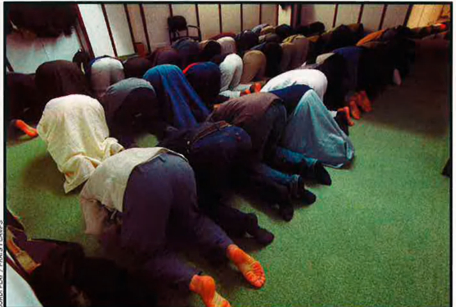
JORDI RAY / PRATS I CAMPS

És ací on la polèmica pot resultar incendiària, perquè els investigadors exigeixen una autorització política per controlar imams i poder escorcollar mesquites.