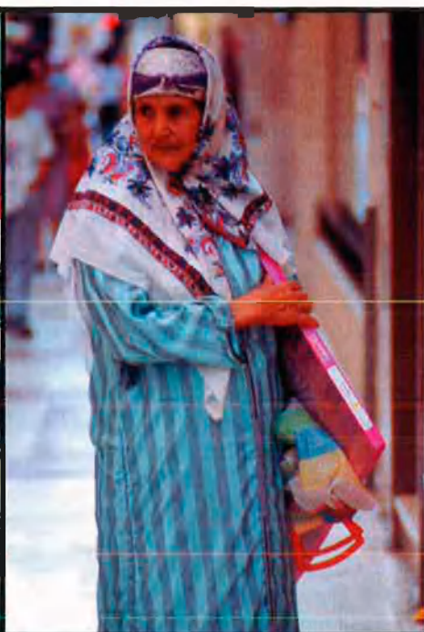
Una imatge dels espantosos atemptats de l'11-M a Madrid. Al costat, una immigrant musulmana. L'horror de la matança ha creat una ombra sobre els musulmans que ara cobrirà aspectes de la seua vida, com és la pregària de culte.

Alonso pretén establir un registre de control de totes les activitats religioses, no sols de les islàmiques, en què ha de constar de manera oberta qui és la persona encarregada d'oficiar el culte i de quin tipus de cerimònia es tracta. És a dir, que no es practique ni el wahabisme ni altres doctrines que facen una interpretació tradicionalista extrema de l'islam. Aquest corrent de l'islam, però, és ben comú en molts cultes islàmics –per exemple, en un terç dels que se celebren al País Valencià–. I en part la causa és la falta de finançament en què el PP ha deixat els cultes no catòlics. Aràbia Saudita, bressol de l'integrisme, s'ha fet càrrec de finançar algunes de les grans mesquites del nostre territori, en moltes de les quals oficien imams que escampen el wahabisme en els seus sermons. I també ha ajudat en gran part a la construcció de molts llocs de culte més menuts, petites mesquites en les quals se celebren reunions de fidels de caràcter més privat. En aquestes, els sermons es poden convertir més discretament en flames a favor del radicalisme més extrem.