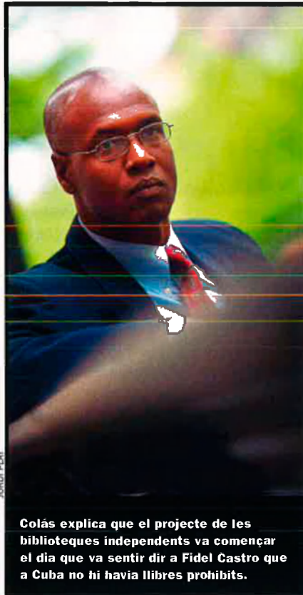
Colás explica que el projecte de les biblioteques independents va començar el dia que va sentir dir a Fidel Castro que a Cuba no hi havia llibres prohibits.

—No. La Constitució cubana diu que si 10.000 cubans demanen que es plantegi alguna cosa, l’Assemblea ha de respondre i fer modificacions. Doncs quan el Projecte Varela va arribar a l’Assemblea seguint aquest procés, Castro va treure més de 9 milions de cubans al carrer per decla-