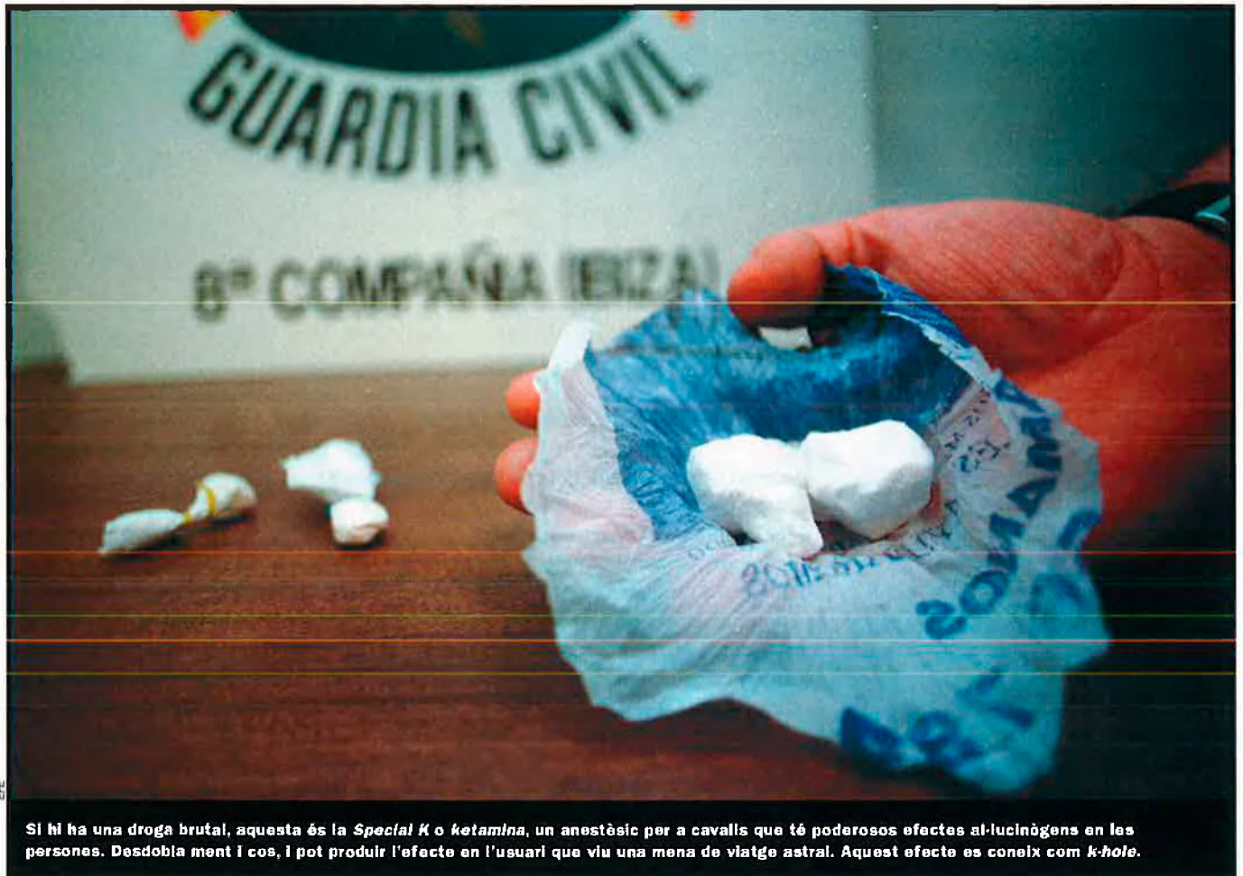
Si hi ha una droga brutal, aquesta és la Special K o ketamina , un anestèsic per a cavalls que té poderosos efectes al·lucinògens en les persones. Desdobla ment i cos, i pot produir l'efecte en l'usuari que viu una mena de viatge astral. Aquest efecte es coneix com k-hole .

teix a afegir a l'efecte amfetamínic de les drogues nocturnes ja tradicionals —cocaïna, speed o pastilles d'èxtasi— una sensació brutal al·lucinògena que evoca el que, anys enrere, produïen entre molts joves drogues avui satanitzades com l'LSD o l'heroïna. Així, l'inconscient hàbit d'establir un policonsum toxicològic el cap de setmana —pràctica que es va consolidar la passada dècada—, ara es nodreix de nous i radicals elements. S'hi uneixen passat i present en un nou futur d'evasió delirant, potser com a metàfora de la representació grotesca de la incomunicació i de la rapidesa autodestructiva que defineix l'actualitat social d'occident. A finals dels vuitanta i durant els noranta, la "ruta del bakalao", i després l'anomenada "cultura de club", anaren amarant la joventut de la veneració a les discoteques com a forma ja no d'entreteniment sinó com a opció de vida. El combustible per a recórrer els distints circuits de discoteques no podien ser els opiàcs, perquè el